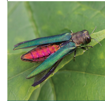
Agrile du frêne

La prévention est essentielle pour empêcher que ces espèces se répandent.