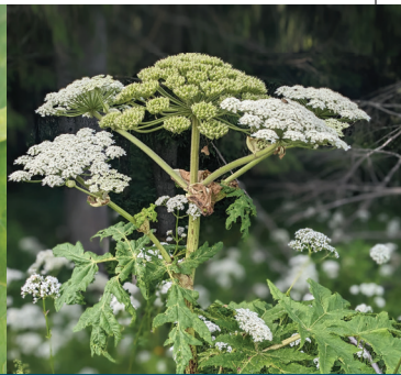
Berce du Caucase