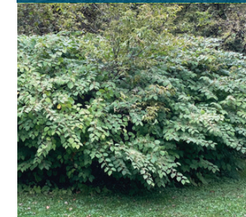
Renouée du Japon